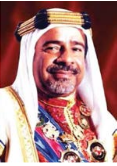
المغفور له بإذن الله تعالى صاحب العظمة الشيخ عيسى بن سلمان آل خليفة طيب الله ثراه