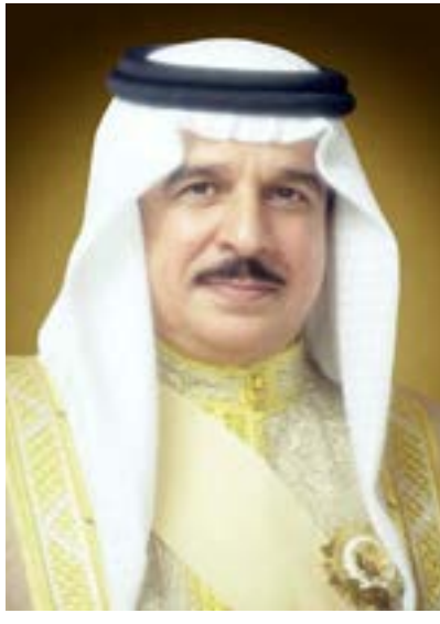
حضرة صاحب الجلالة الملك حمد بن عيسى آل خليفة ملك مملكة البحرين المعظم حفظه الله ورعاه