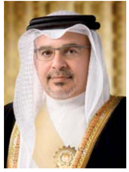
صاحب السمو الملكي الأمير سلمان بن حمد آل خليفة ولي العهد رئيس مجلس الوزراء حفظه الله