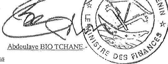
Abdoulaye BIO TCHANE