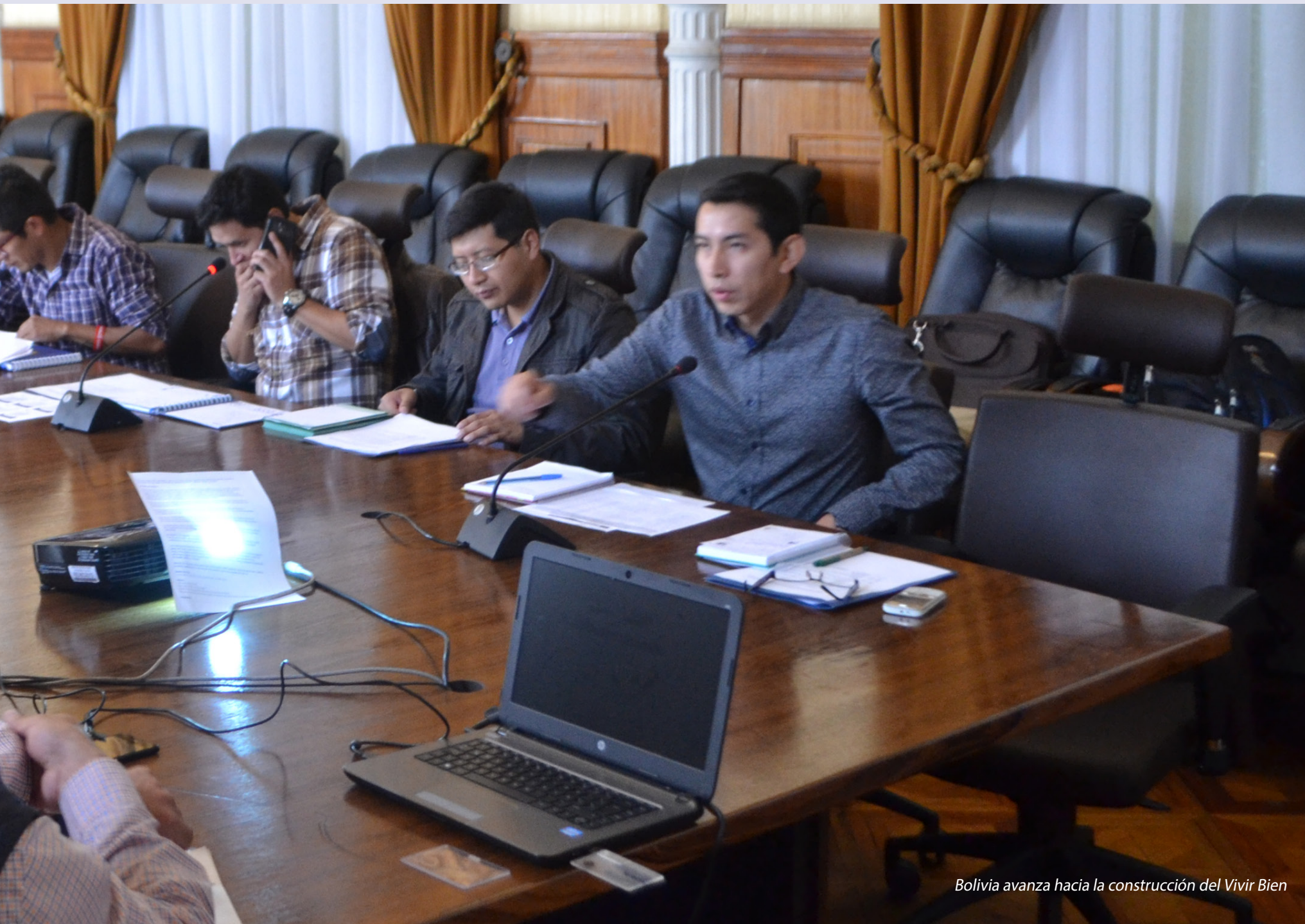
Bolivia avanza hacia la construcción del Vivir Bien