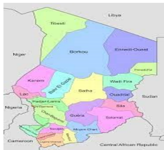
Figure1. Carte administrative du Tchad

Conformément à la loi N°010/PCMT/2022 du 19 mai 2022, portant modification de la loi 006/PCMT/2021 du 06 octobre 2021 portant Restructuration des Unités administratives et les collectivités autonomes, les Unités administratives et les collectivités autonomes sont restructurées en vingt-trois (23) provinces, cent quinze (115) départements et quatre cents vingt-deux (422) Sous-préfectures/communes.