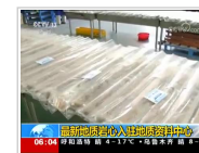
最新地质岩心入驻地质资料中心