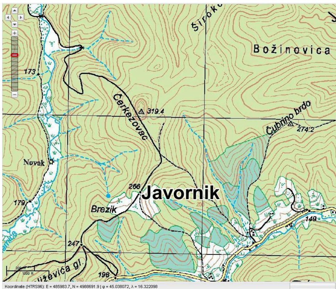
Slika 1-1: Topografska karta užeg područja lokacije Čerkezovac[1]

Vojna lokacija Čerkezovac nalazi se u Općini Dvor u sastavu Sisačko-moslavačke županije na 45°2'12.29" sjeverne geografske širine i 16°19'24.06" istočne geografske dužine. Lokacija pripada području Mjesnog odbora Javornik. Smještena je na južnim obroncima Trgovske gore na području nadmorske visine 280-320 m s najvišim vrhom 319.4 m (Slika 1-1). Vojno skladišni kompleks zauzima površinu od 0,6 km 2 (60 ha). Čerkezovac je smješten jugozapadno od grada Dvora (na Uni) na udaljenosti od oko 6 km zračne linije. Od državne granice s Bosnom i Hercegovinom, koja se podudara s tokom rijeke Une, lokacija je udaljena oko 3 km na istoku, odnosno oko 4 km na jugu. Obližnji veći gradovi u Republici Hrvatskoj su: Hrvatska Kostajnica 27 km, Glina 40 km, Petrinja 48 km, Sisak 50 km te Zagreb na udaljenosti 90 km zračne linije.