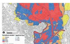
Obr. 2 Příklad mapy ohrožení

Výsledné maximální hodnoty ohrožení se zobrazují pomocí barevné škály (tab.2) do mapy ohrožení (obr. 2). Záplavové území je tak rozčleněno z hlediska povodňového ohrožení. Toto členění umožňuje posouzení vhodnosti stávajícího nebo budoucího funkčního využití ploch a doporučení na omezení případných aktivit na plochách v záplavovém území s vyšší mírou ohrožení (viz tab. 2).