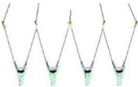
Fig. 2.1.5. Eksempel på multirigsystem, hvor der anvendes 4 trawl, der spredes med to sæt medskovle og en center klump. Denne rig slæbes i fem wirer.

Figur 2.1.5 viser et eksempel på et 4-trawlsystem (tegning SEAFISH). Med multirigsystemer menes, at der fiskes med 4 trawl eller flere samtidigt. Multirigsystemer kan også have andre udformninger med f.eks. to trawlskovle og kun en ”klump” og ”hanefødder”. Dette system reducerer fangst af rundfisk og er dermed mere selektivt for jomfruhummer.