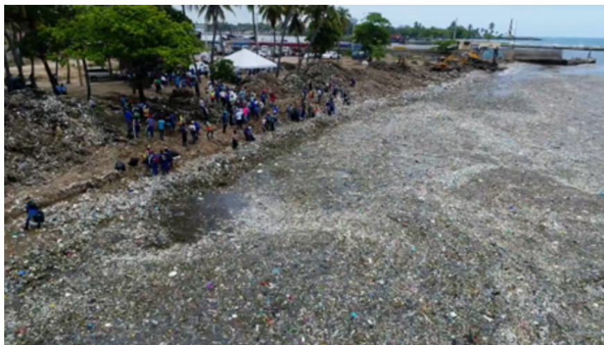
Figura 1: Mar Caribe en Santo Domingo tras el paso de la tormenta Beryl.

La República Dominicana tiene una línea costera de 1,668.3 km, incluyendo el litoral principal y sus islas adyacentes 1 . La contaminación por residuos marinos se debe en gran medida al comportamiento humano, ya sea de manera accidental o intencional. La mayor contribución proviene de actividades terrestres, vertido de residuos en las playas, turismo y uso recreativo de las costas, actividades de la industria pesquera, astilleros de desguace y transportación marítima. Los eventos relacionados con las tormentas, como las inundaciones, arrojan los desechos resultantes al mar, donde se hunden hacia el fondo o son transportados por remolinos costeros y corrientes oceánicas. Por ejemplo, recordamos que en julio del 2018 el paso de la tormenta Beryl provocó que la costa del mar Caribe en Santo Domingo fuera inundada por residuos sólidos. Se necesitó un equipo de limpieza de más de 500 personas formado por residentes, militares y el Ayuntamiento del Distrito Nacional (ADN) que recogió 30 toneladas de residuos en tres días (BBC News 2018).