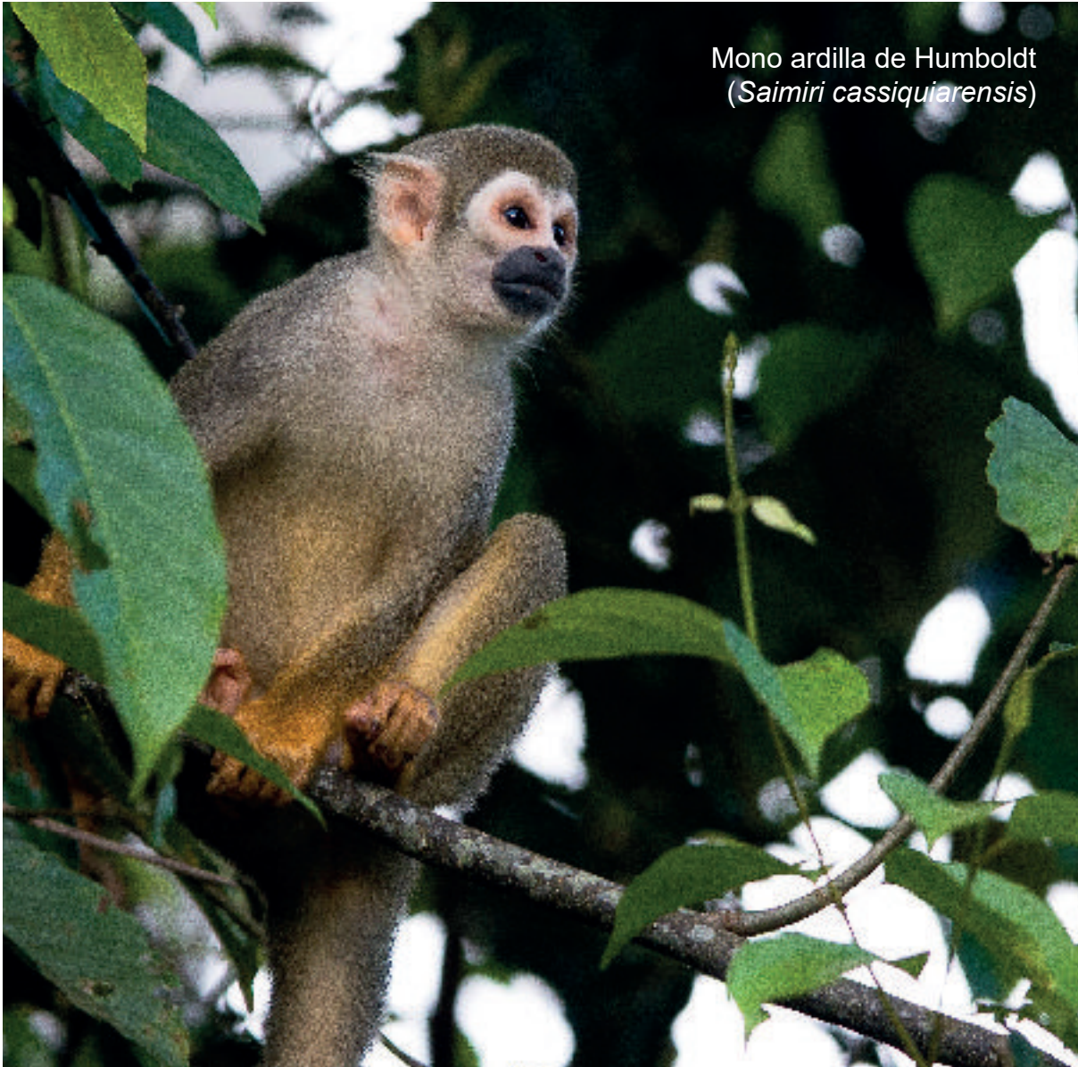
Mono ardilla de Humboldt ( Saimiri cassiquiarensis )