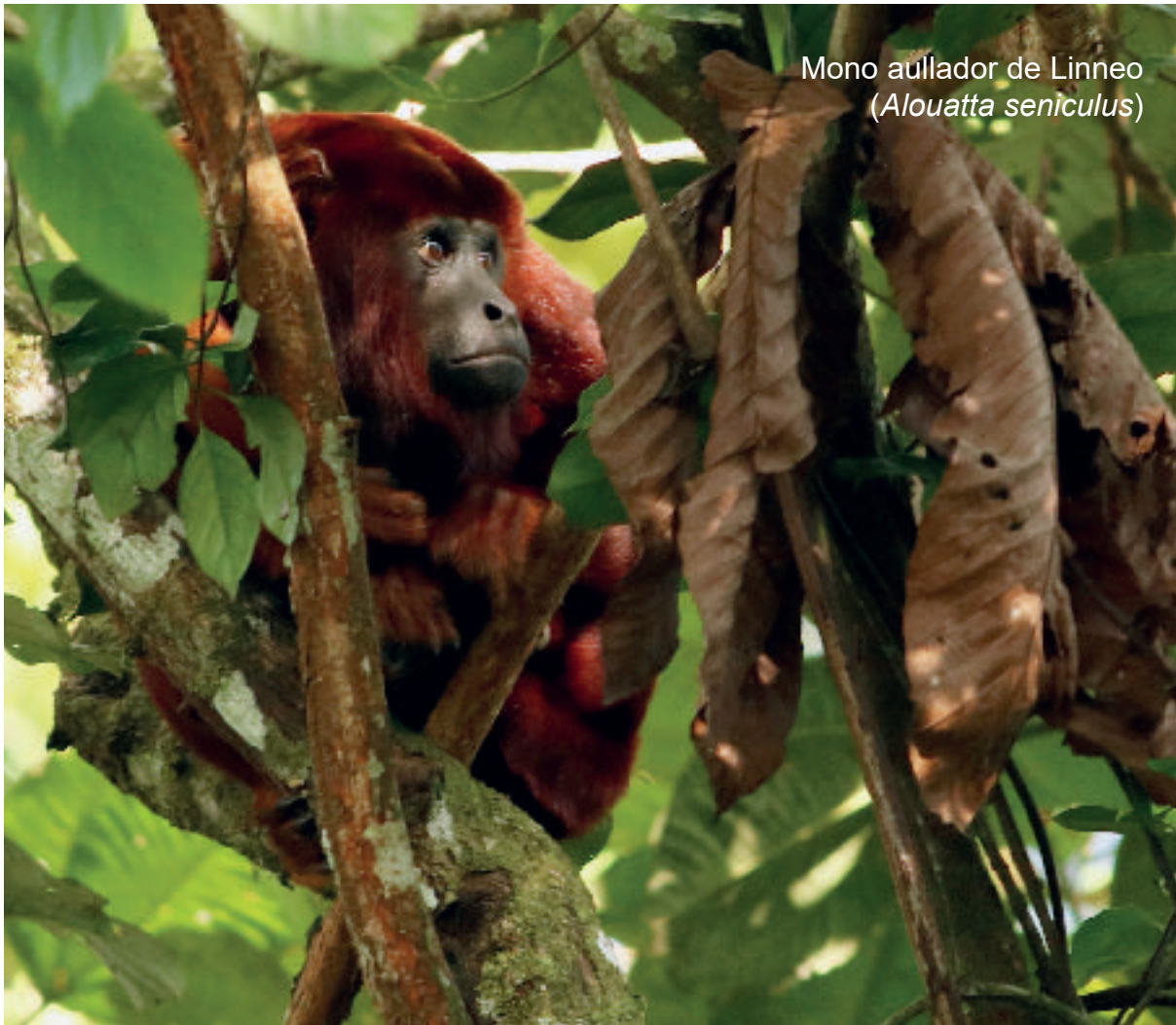
Mono aullador de Linneo ( Alouatta seniculus )