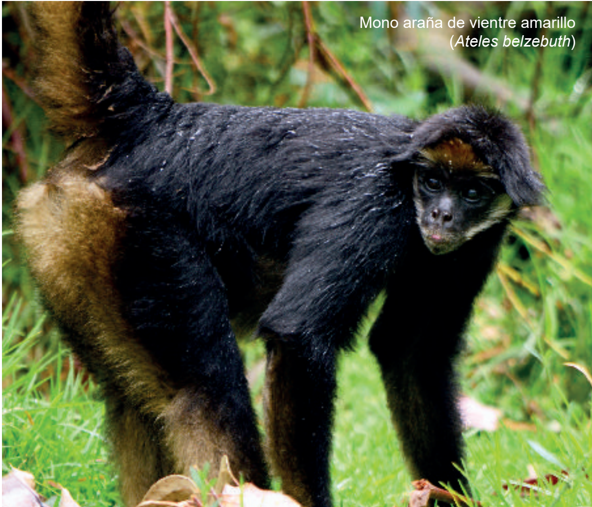
Mono araña de vientre amarillo ( Ateles belzebuth )