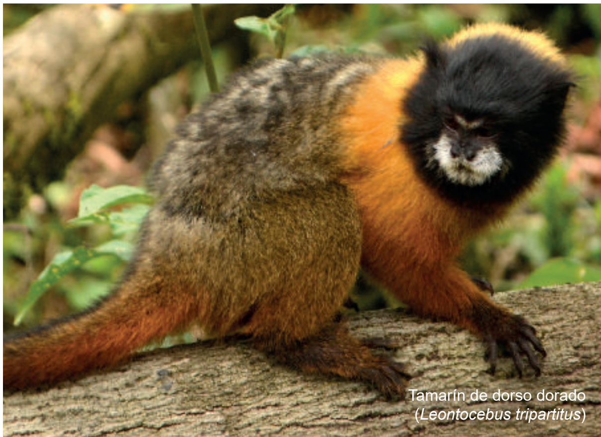
Diego G. Tírra / Archivo Murciélagos Blanco