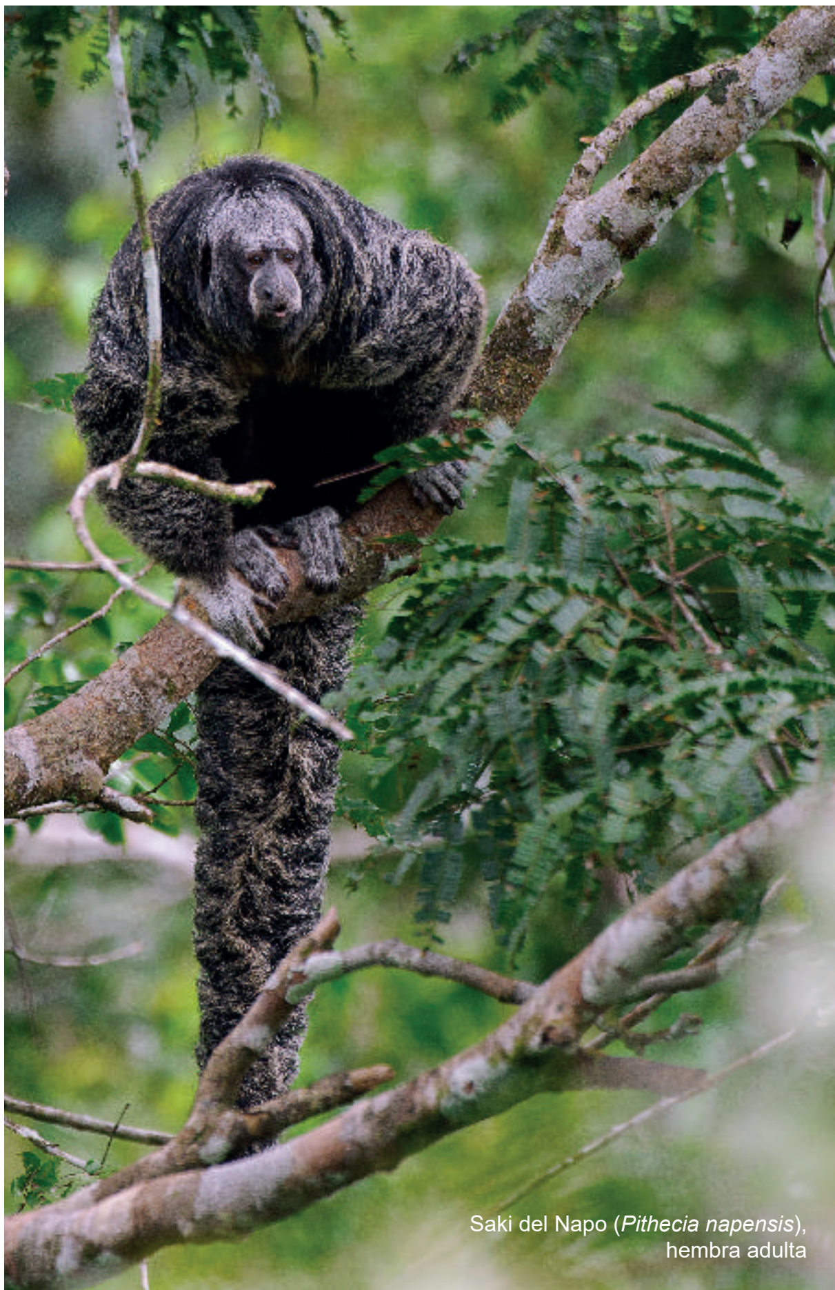
Saki del Napo ( Pithecia napensis ), hembra adulta