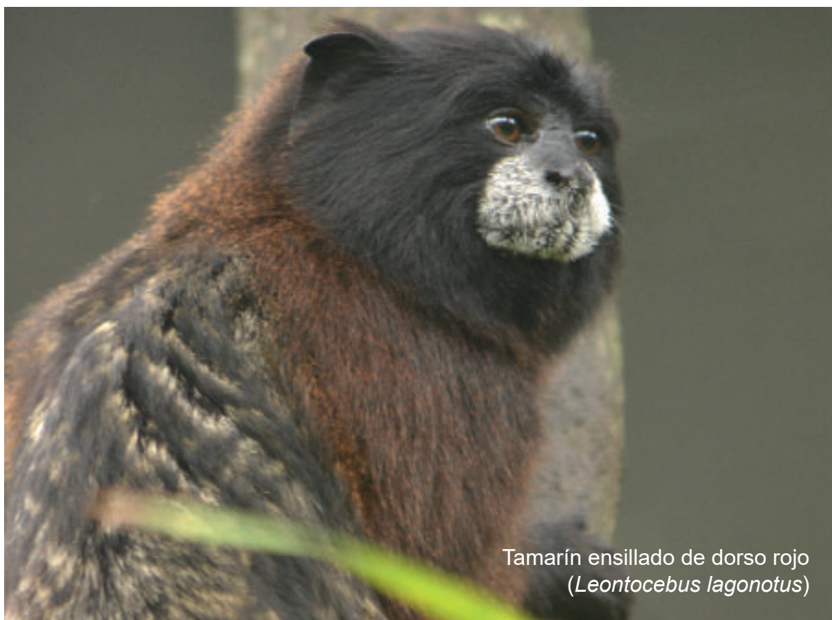
Tamarín ensillado de dorso rojo ( Leontocebus lagotus )