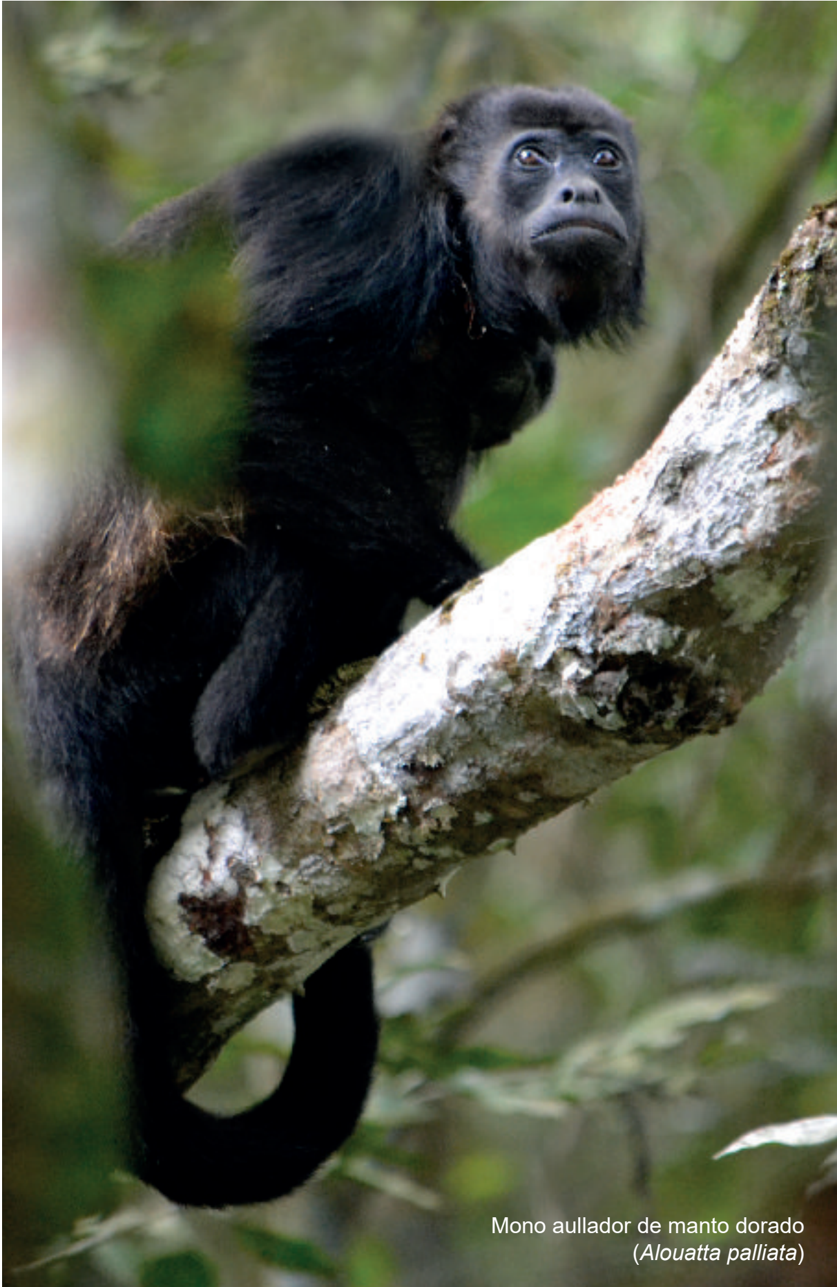
Mono aullador de manto dorado ( Alouatta palliata )