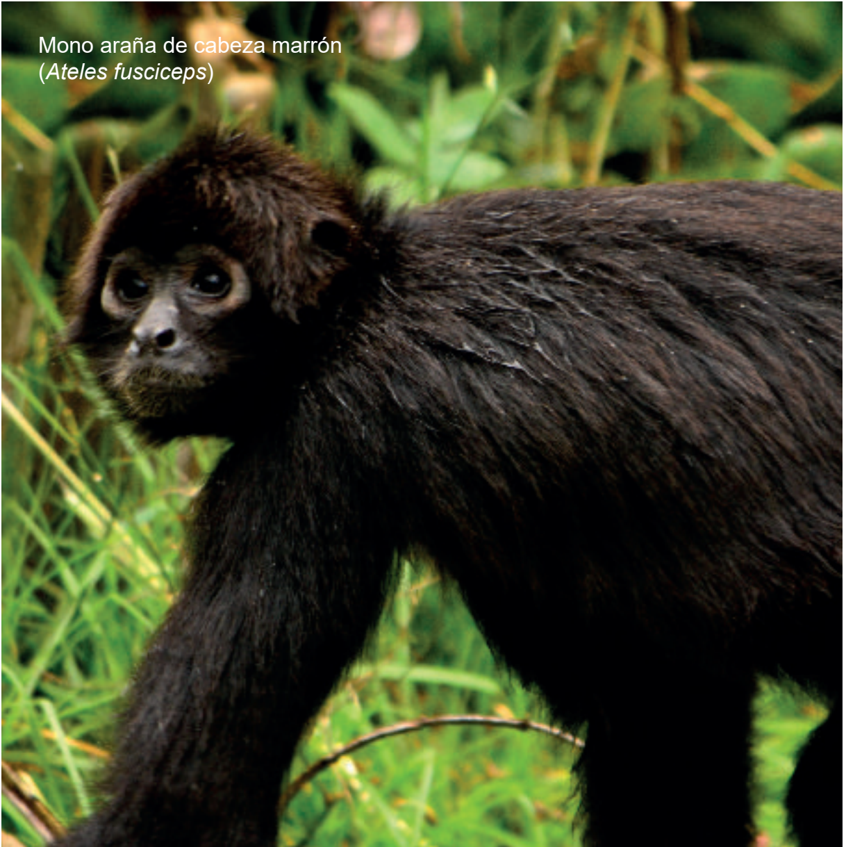
Mono araña de cabeza marrón ( Ateles fusciceps )