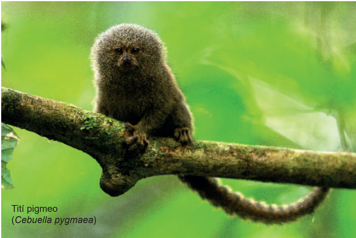
Tití pigmeo ( Cebuella pygmaea )