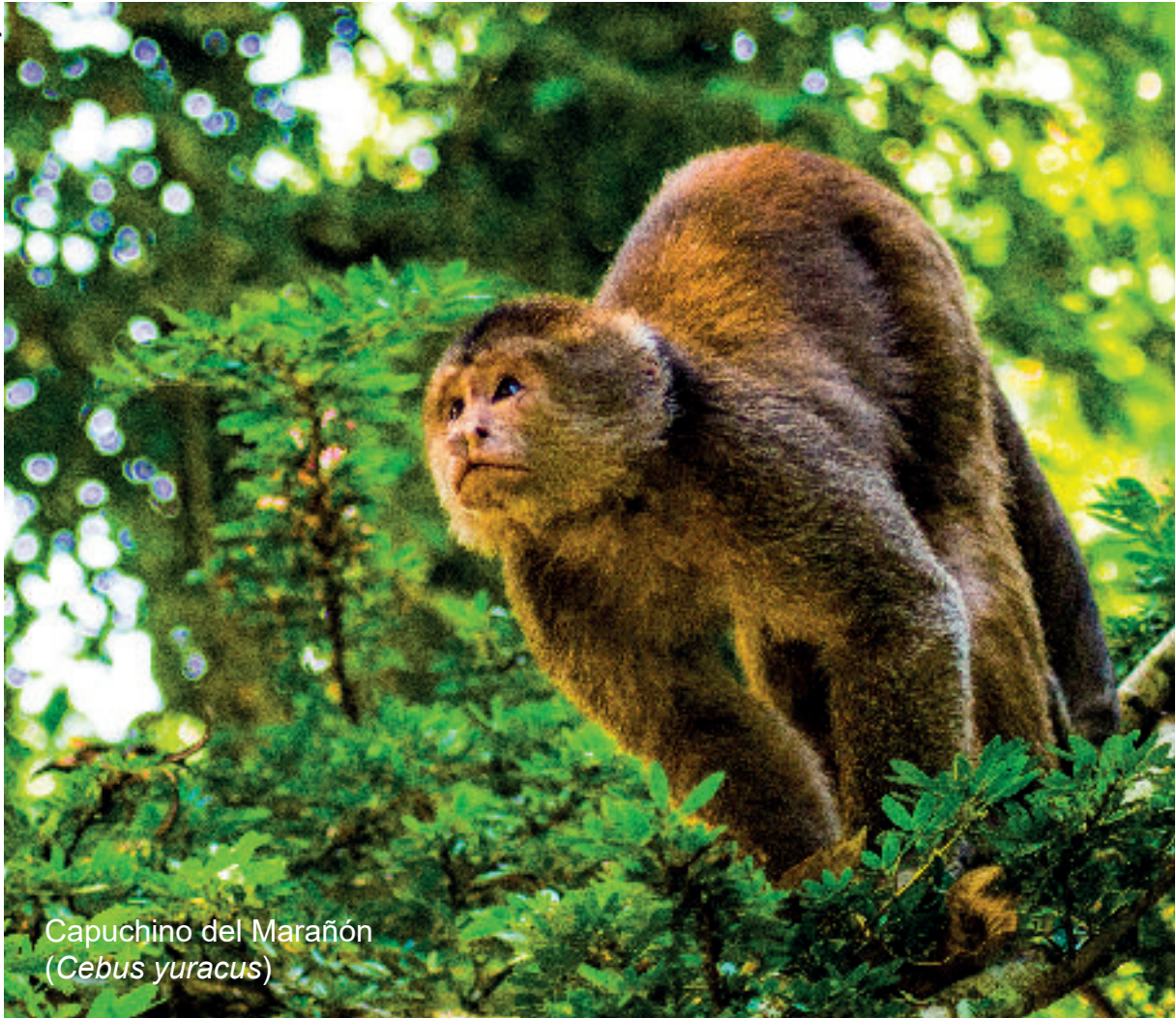
Capuchino del Marañón ( Cebus yuracus )

El taller se estructuró en sesiones de conferencias de expertos, bloques de discusión y plenarias (anexo 1.2). Se realizaron 18 presentaciones sobre diversas temáticas que incluyeron distribución, ecología y estado de conservación de los primates ecuatorianos, principales amenazas, lecciones aprendidas de planes de acción anteriores sobre otros grupos de mamíferos, bases sobre derecho animal, procedimientos veterinarios y planeamiento estratégico de planes de acción. Los conocimientos expuestos durante las conferencias sirvieron para que las discusiones subsecuentes tuvieran una base sólida y contaran con el asesoramiento de expertos en el tema.