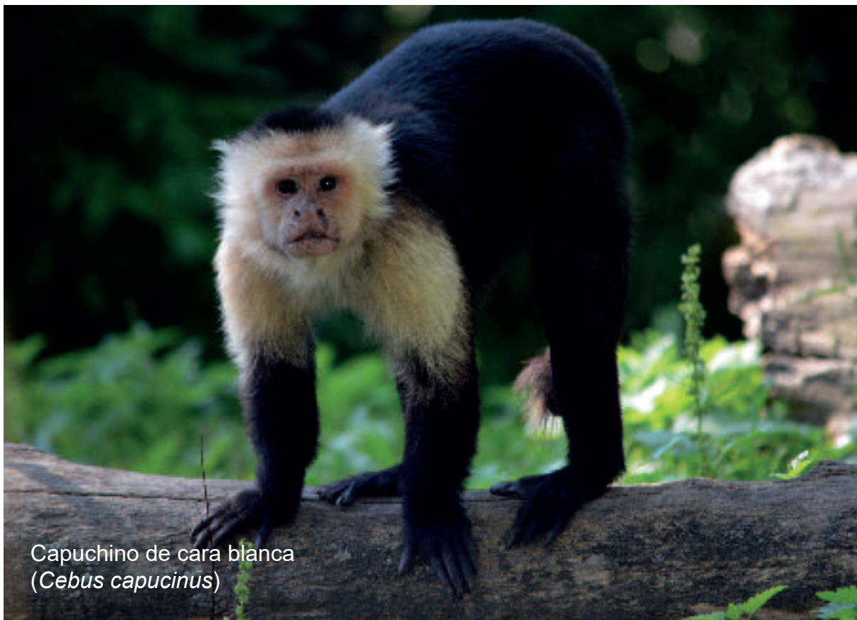
Capuchino de cara blanca ( Cebus capucinus )