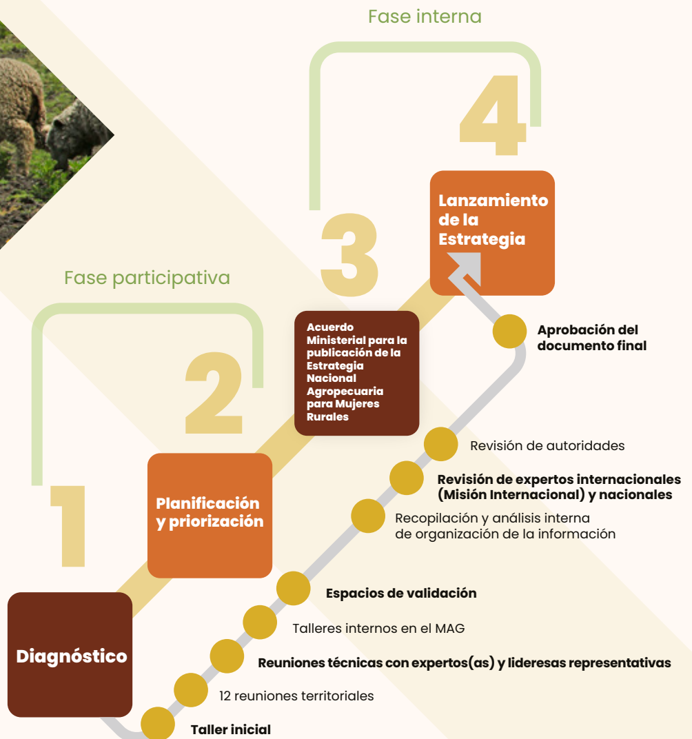
Gráfico 1. Proceso de construcción de la Estrategia Nacional Agropecuaria para Mujeres Rurales

E l proceso para la construcción y lanzamiento de la Estrategia Nacional Agropecuaria constó de cuatro fases, las mismas que se detallan en el siguiente gráfico: