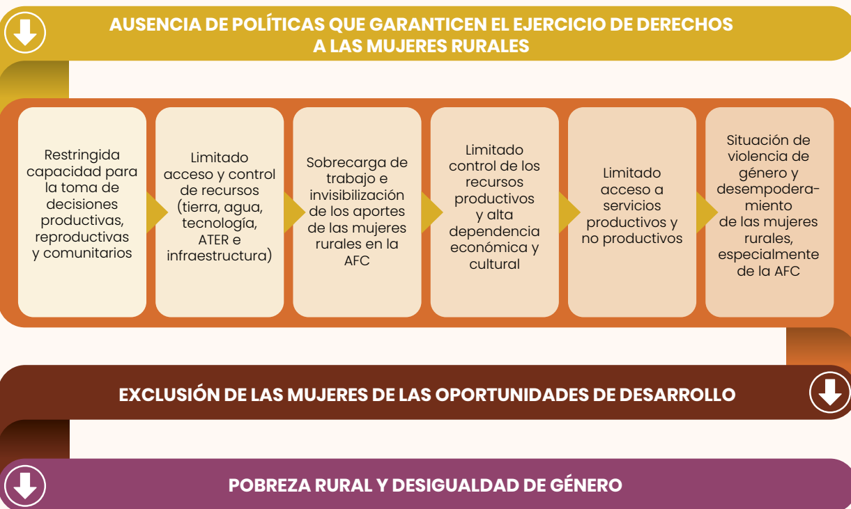
Gráfico 3.: Barreras de género que afectan a las mujeres rurales del sector agropecuario