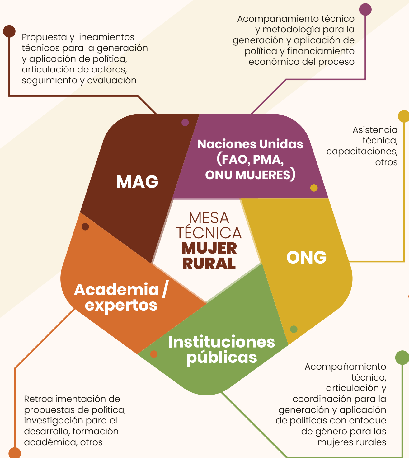
Gráfico 2. Alianzas interinstitucionales para el proceso