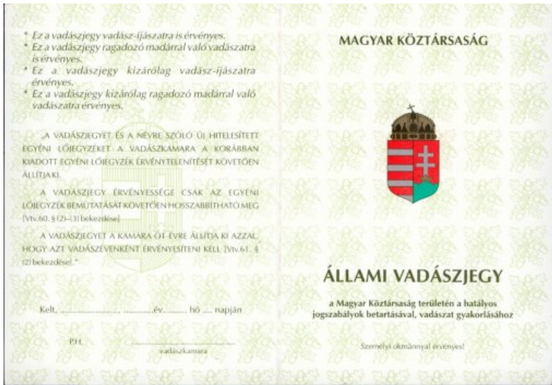
MINTA első és második oldala