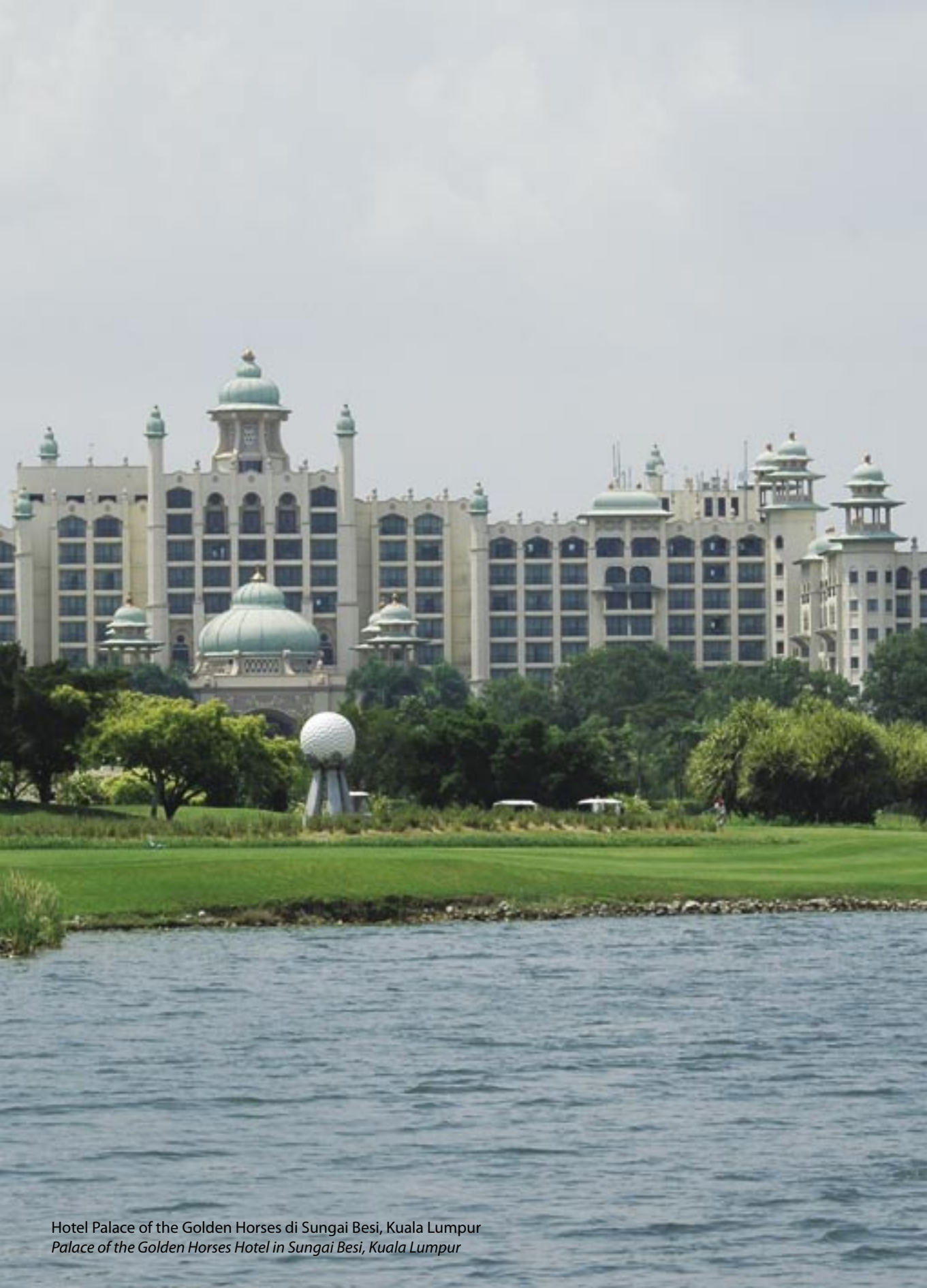
Hotel Palace of the Golden Horses di Sungai Besi, Kuala Lumpur Palace of the Golden Horses Hotel in Sungai Besi, Kuala Lumpur