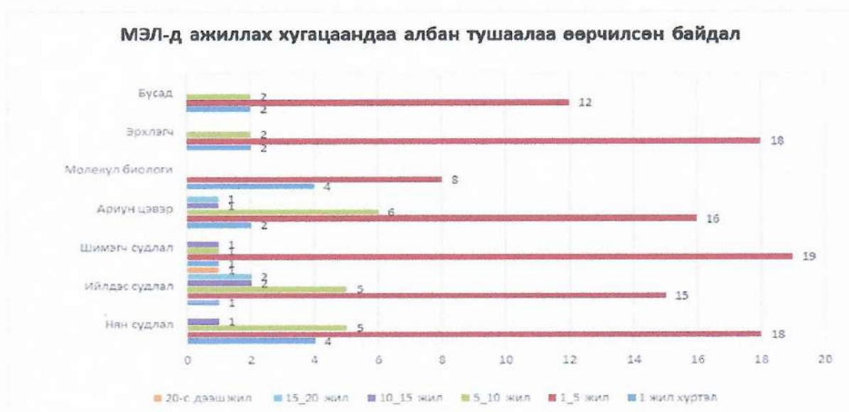
График 2. МЭЛ-т ажиллах хугацаандаа албан тушаалаа өөрчилсөн байдал

3. АМЭЛ-д ажиллаж буй эмч нарыг лабораторийн албан тушаалд ажилласан байдал, хугацаагаар нь судалж үзэхэд лабораторийн нян, ийлдэс, шимэгч, ариун цэврийн шинжээч, лаборантын ажилд сүүлийн 5 жилд шинэ төгсөгч эмч олноор томилогдон ажиллаж байгаа боловч дээрх ажлын байруудад тогтвортой ажиллаагүй, нэг ажлын байранд олон удаа сэлгэж, орж гарч, өөрчлөгдөж, маш тогтворгүй ажилласан нь харагдаж байна (График 2).