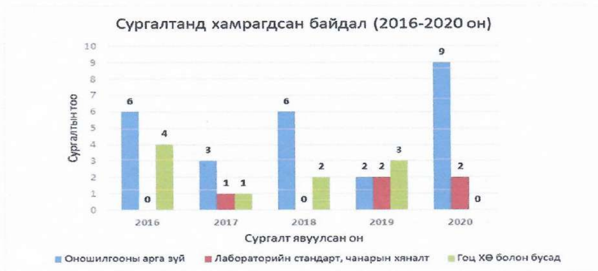
График 3. МЭЛ-ийн шинжээч нар сургалтад хамрагдсан байдал

АМЭЛ-ийн эмч нарын сүүлийн 5 жилийн сургалтад хамрагдсан байдлыг судалж үзэхэд (График 3) 2016-2021 онд нийт 40 гаруй удаагийн сургалтад хамрагдсан боловч АМЭЛ-ийн эмч нарыг тухайн эрхэлж буй ажил үүргийн чиглэлээр нийтлэг хамруулсан чадавхжуулах сургалт хийгдээгүй, өөрөөр хэлбэл 2017 оноос хойш УМЭАЦТЛ-ос зохион байгуулсан зорилтот өргөн хүрээний төлөвлөгөөт сургалтууд хийгдээгүй байна. Нийт сургалтын 85 хувь нь 1-5 эмчийн хүрээнд хийгдсэн, АМЭЛ-уд өөрсдийн хүсэлт, санаачилгаар дадлагажих, дагалдан сурах хэлбэрээр хамрагдсан нь ажиглагдаж байна. Иймд сүлжээ лабораториудын эмч нарыг чадавхжуулах сургалтын бодлого төлөвлөгөө зайлшгүй хэрэгтэй байна.