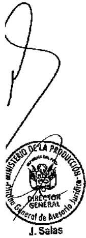
OLLANTA HUMALA TASSO Presidente Constitucional de la República

Dado en la Casa de Gobierno, en Lima, a los veintitres días del mes de febrero del año dos mil quince.