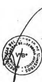
PEDRO CATERIANO BELLIDO Presidente del Consejo de Ministros