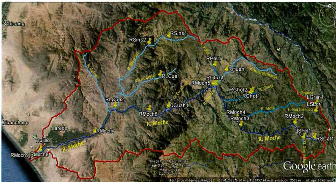
Gráfico 2. Cuenca del río Moche, mostrando la red de puntos de monitoreo.