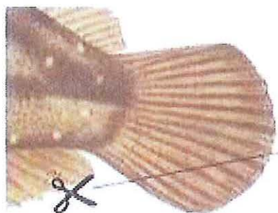
Caudale bifide inférieure