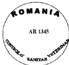
Figura nr. 2