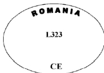
Figura nr. 6