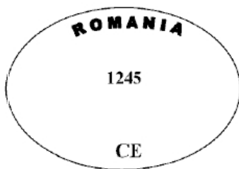
Figura nr. 1