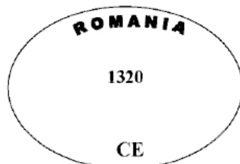
Figura nr. 1