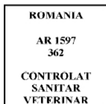
Figura nr. 5