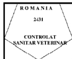
Figura nr. 4