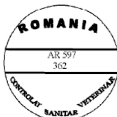
Figura nr. 9