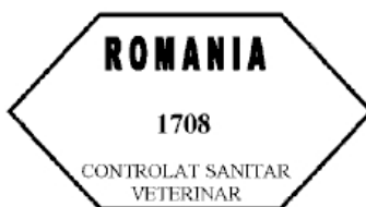
Figura nr. 3