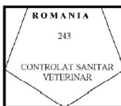
Figura nr. 11