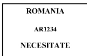
Figura nr. 7