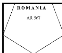
Figura nr. 12