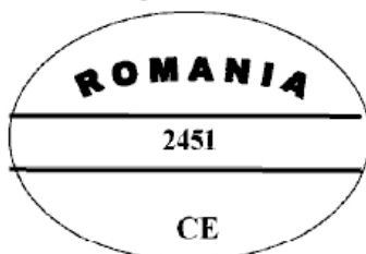
Figura nr. 10