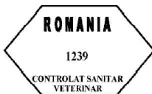
Figura nr. 3