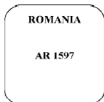
Figura nr. 6