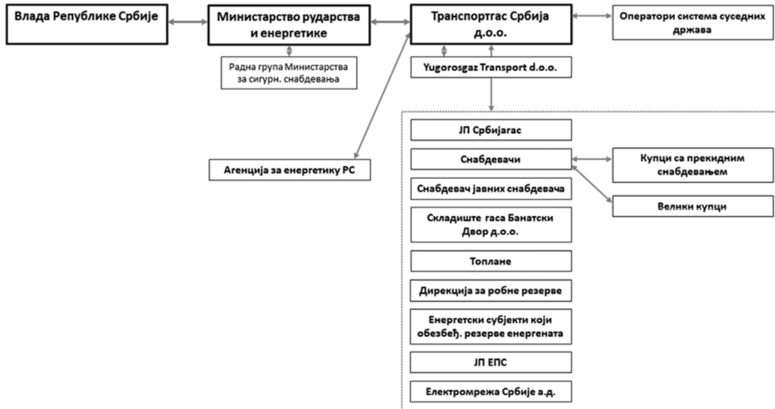
Слика 3: Одговорне стране и ток информација при Нивоу 3 кризе