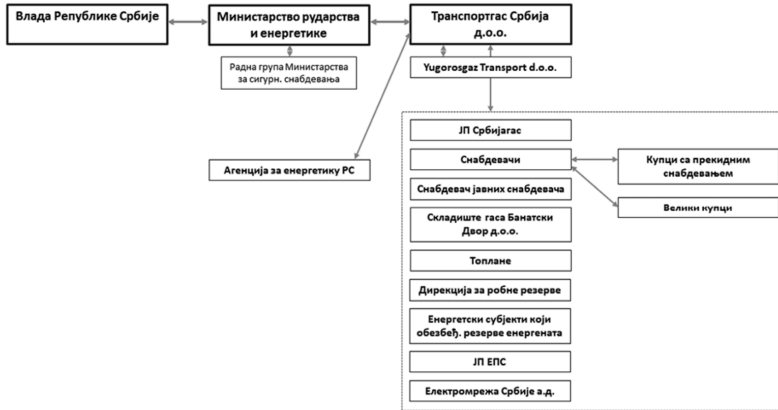
Слика 2: Одговорне стране и ток информација при Нивоу 2 кризе