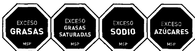
Figura 1. Diseño del rotulado frontal a ser utilizado en la cara frontal de las etiquetas.

El rotulado frontal consistirá de símbolos con diseño octagonal y fondo negro y borde blanco, que contendrán en su interior la expresión "EXCESO" seguida del nutriente que corresponda: GRASA, GRASAS SATURADAS, AZÚCARES o SODIO, según se detalla en la Figura 1. Se incluirá un símbolo por cada nutriente que se encuentre en exceso.