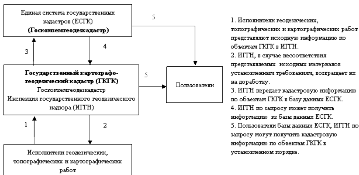
Схема ведения государственного картографо-геодезического кадастра

к Положению о порядке ведения Государственного картографо-геодезического кадастра