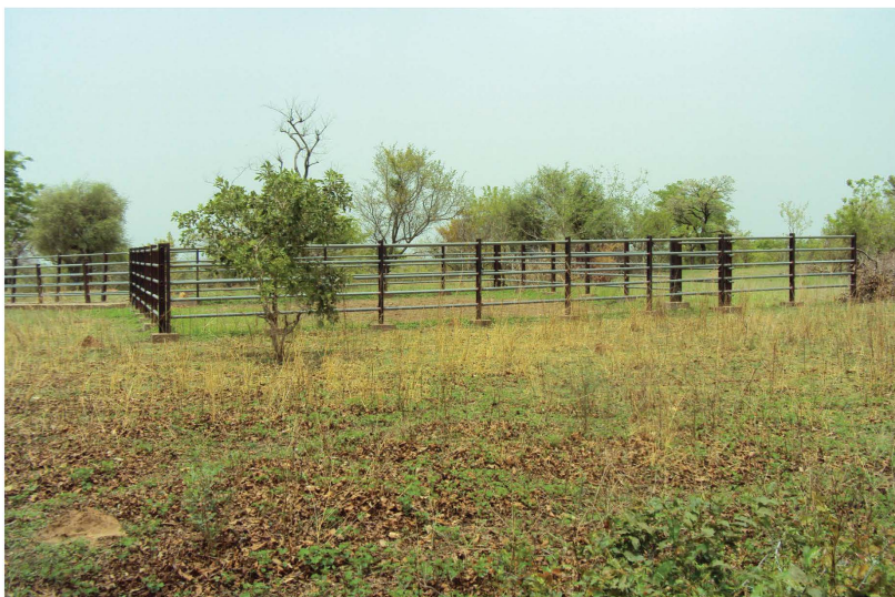
Parc de vaccination dans la région de l'Est.