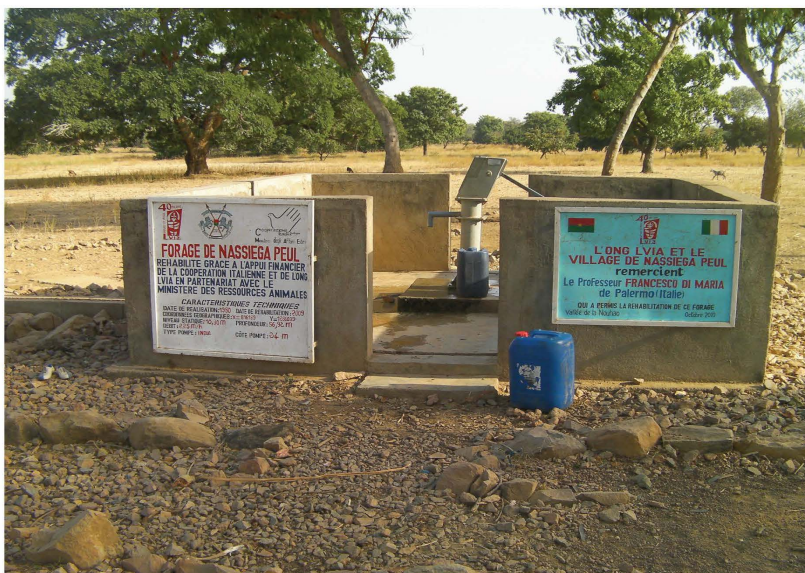
Forage dans la zone pastorale de la Nouhao

Pendant le temps où les pistes à bétail sont sollicitées, il peut être mis en place un dispositif permettant de percevoir, à défaut de taxes, des redevances.