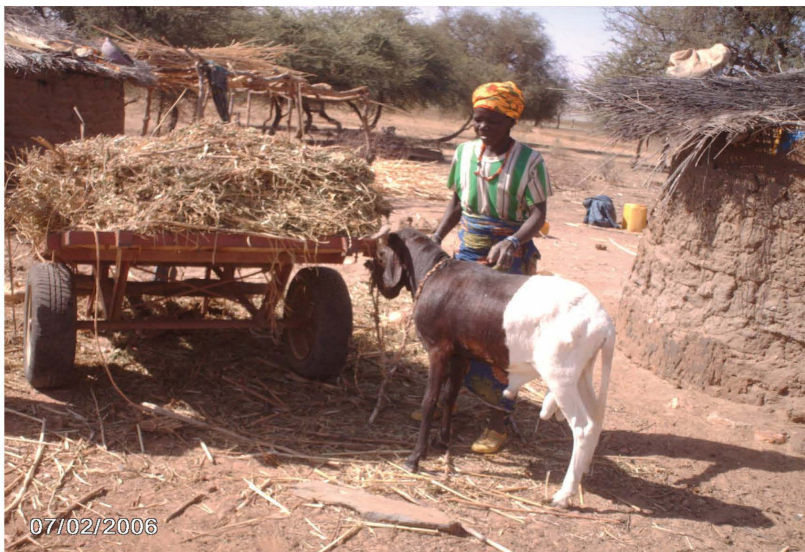
Embouche ovine dans la zone pastorale de Sambonaye