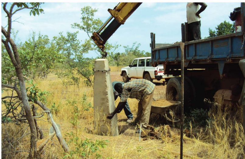
Implantation de balise sur une piste à bétail dans la région de l'Est.

Les réceptions provisoire et définitive des travaux tiendront compte de l'avis des bénéficiaires dont les services techniques et les producteurs. Cette donnée sera mentionnée dans le contrat et le dossier d'appel d'offres.