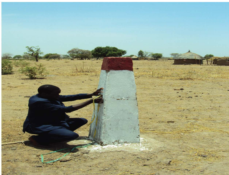
Vérification des dimensions d'une balise implantée

L'équipe de suivi sera légère et décentralisée. Elle sera placée sur le terrain sous la tutelle des autorités de la commune et des CVD et comprendra des représentants des producteurs au niveau des villages concernés.