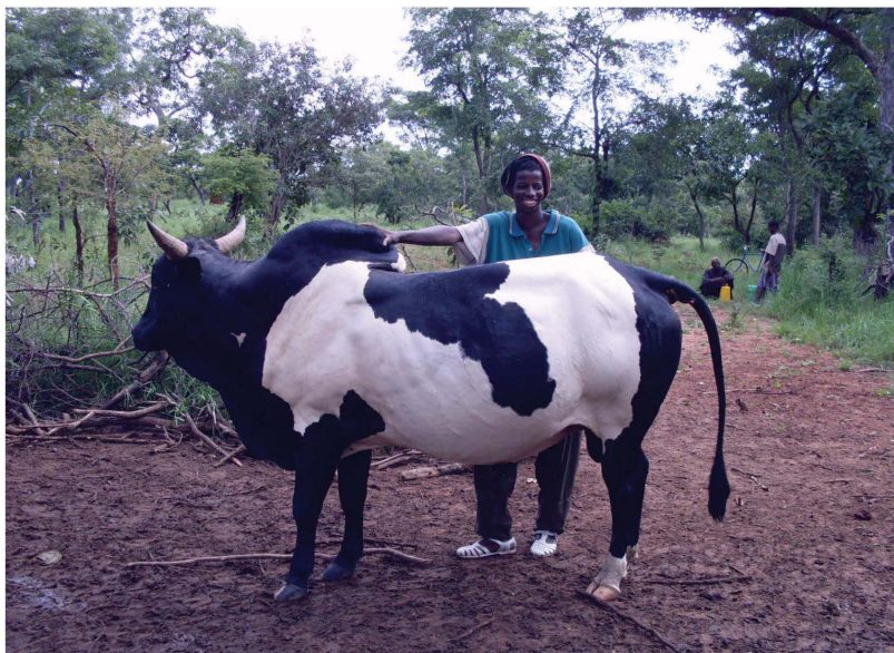
Bovin engraisé de la zone pastorale de Sideradougou (Sources : DGEAP/MRAH)