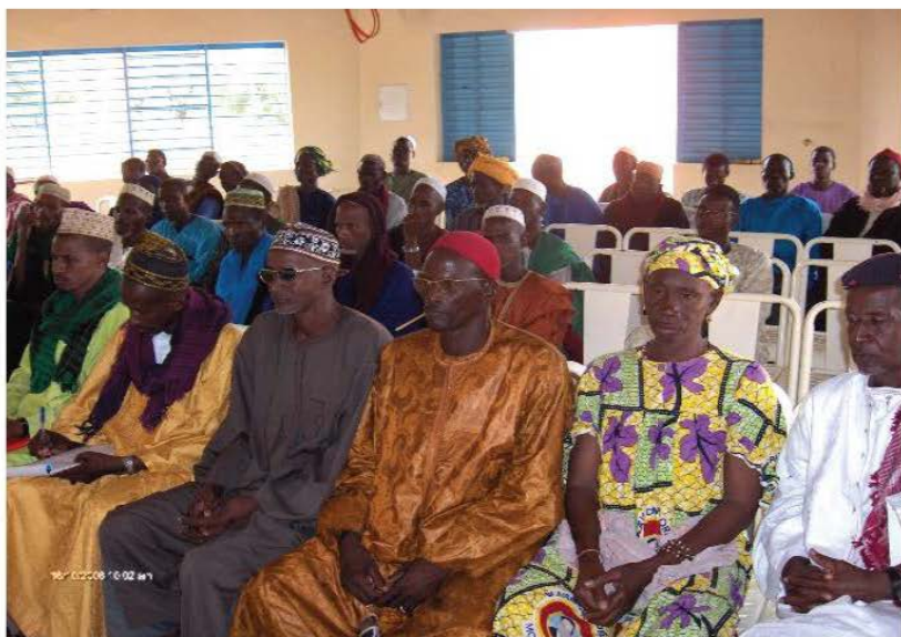
Concertation pour l'élaboration du cahier des charges de la zone pastorale de Barani.