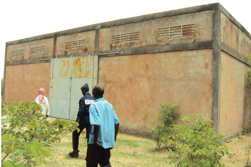
Magasin d'aliment bétail dans la région de la Boucle du Mouhoun