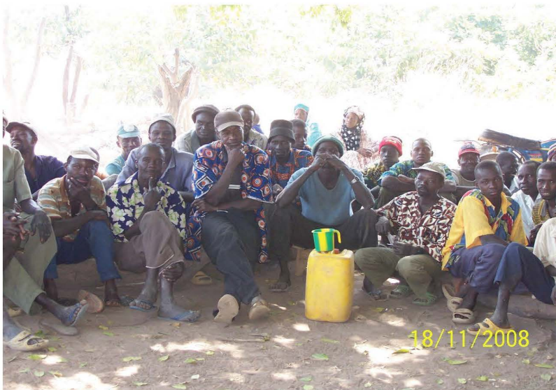
Séance de sensibilisation des éleveurs dans la zone pastorale de Sideradougou