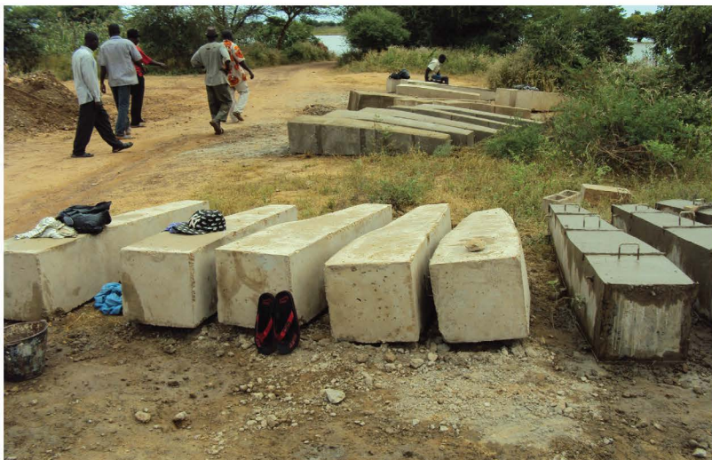
Balises confectionnées dans la région de l'Est