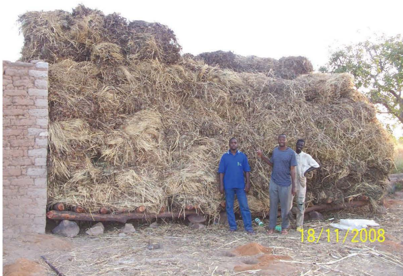
Stock fourrager dans la zone pastorale de Sidéradougou. (Sources : DGEAP/MRAH)