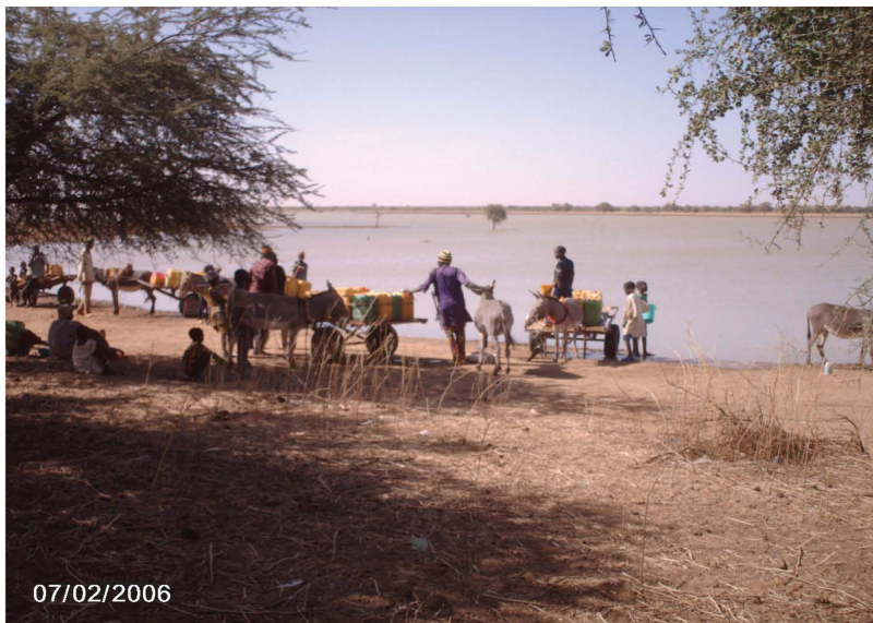
Barrage aménagé dans la zone pastorale de Sambonaye.