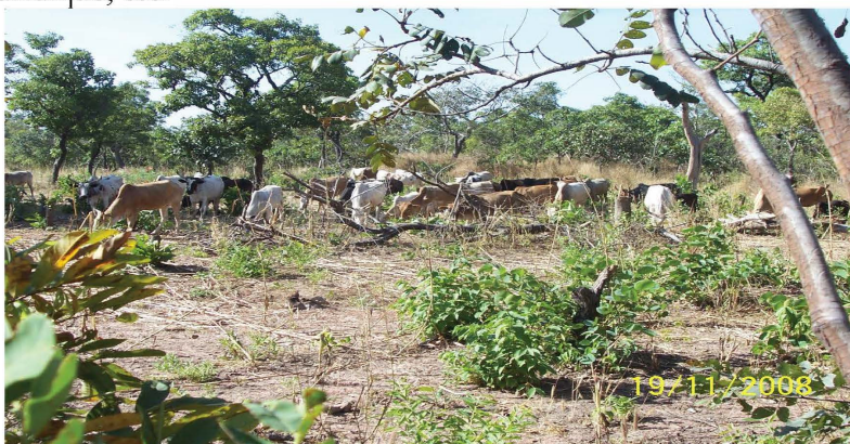
Troupeau de bovins dans la zone pastorale de Sideradougou

La réalisation des opérations d'aménagement des zones pastorales suppose une bonne connaissance du milieu (environnement-homme-animal et leurs interrelations), la définition, la planification et la mise en œuvre des activités à réaliser. 1 . Elle s'appuiera sur la documentation nécessaire existante et sur des études thématiques: pédologie, agrostologie, activités des populations, élevage et systèmes de production, cadre politique et juridique, etc.