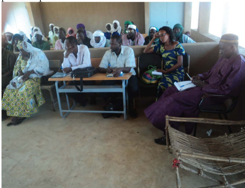
Rencontre d'élaboration du cahier des charges Spécifique de la zone pastorale de Sambonaye. (Sources : DGEAP/MRAH)

La gestion des pistes à bétail peut aussi faire l'objet d'un cahier des charges spécifique entre les Collectivités territoriales concernées et des communautés villageoises ou communales, des organisations professionnelles de producteurs, un opérateur public ou privé.