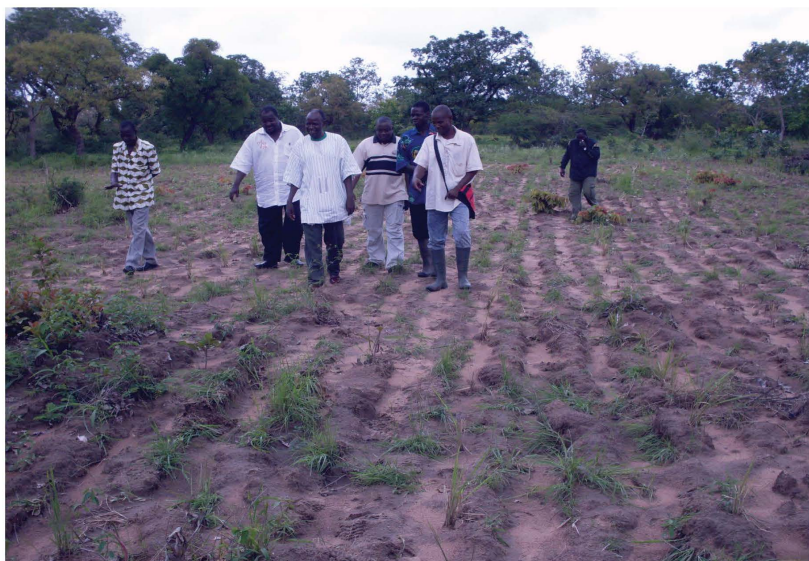
Champ fourrager dans la zone pastorale de Sidéradougou.