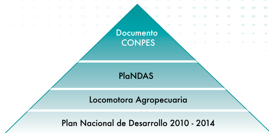
Figura 2. Esquema del proceso de inserción del PlaNDAS en el marco de políticas e instrumentos de desarrollo nacional y sectorial de Colombia.

para implementar el Plan. Eso garantizaría que dicho Plan se consolide como parte de la planeación del desarrollo nacional (Figura 2).