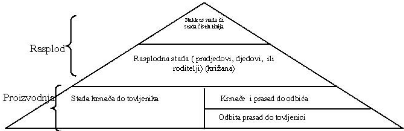
Slika 2. Pregled gospodarstava

pretraživanja salmonele i MRSA-e), na kojima su zastupljena stada kako je prikazano na slici 2. ove podtočke, isključujući odbitu prasid i tovljenike.