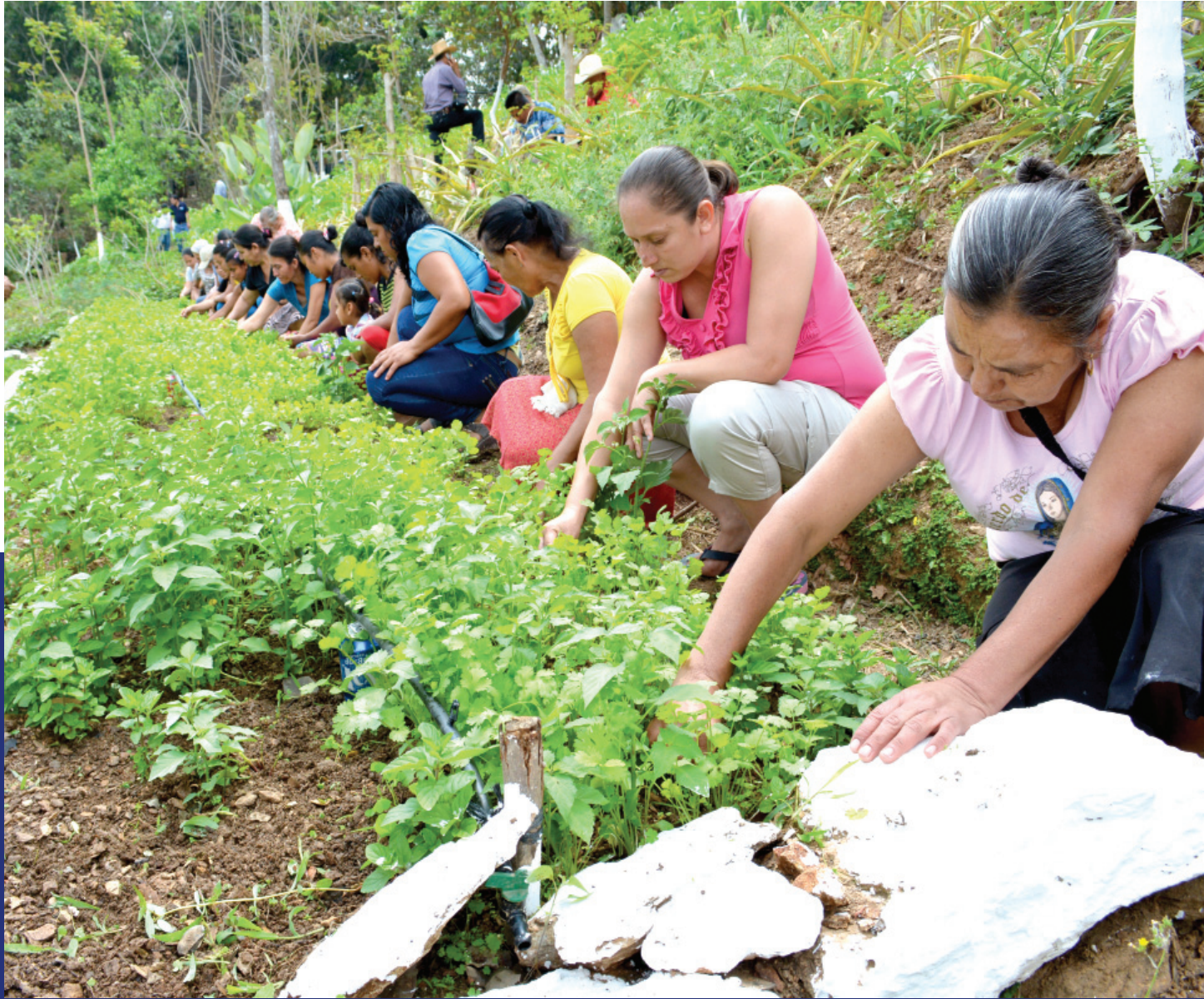
Cultivo de cilantro en barreras vivas CADER, Granados, Baja Verapaz