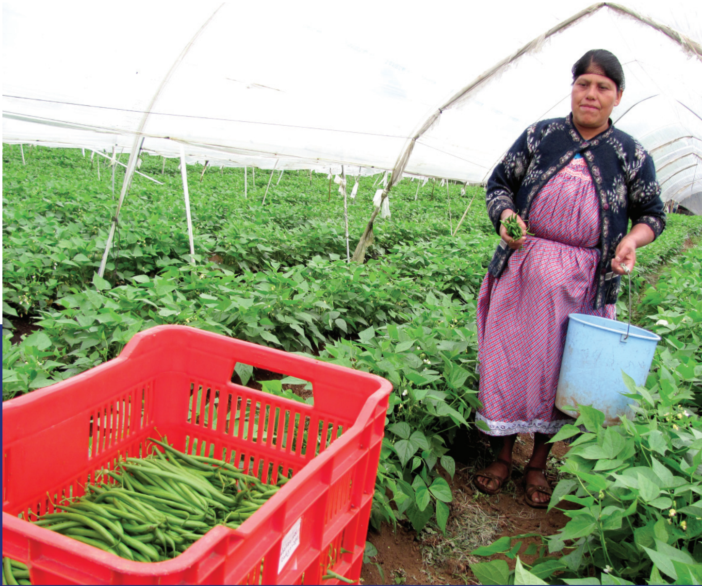
Cultivo de ejote francés. Tactic, Alta Verapaz.