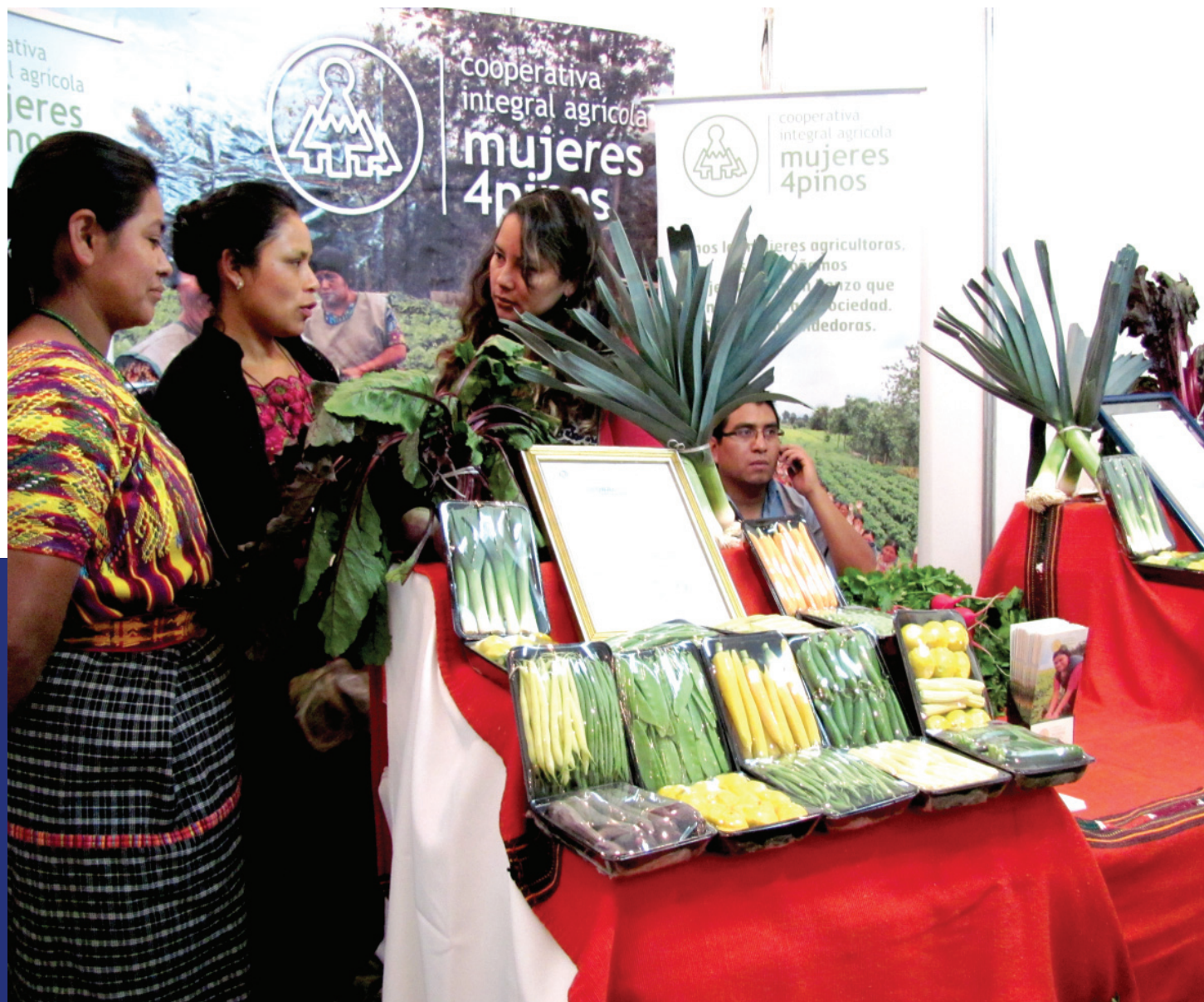
Cooperativa integral agrícola "Mujeres 4 pinos"