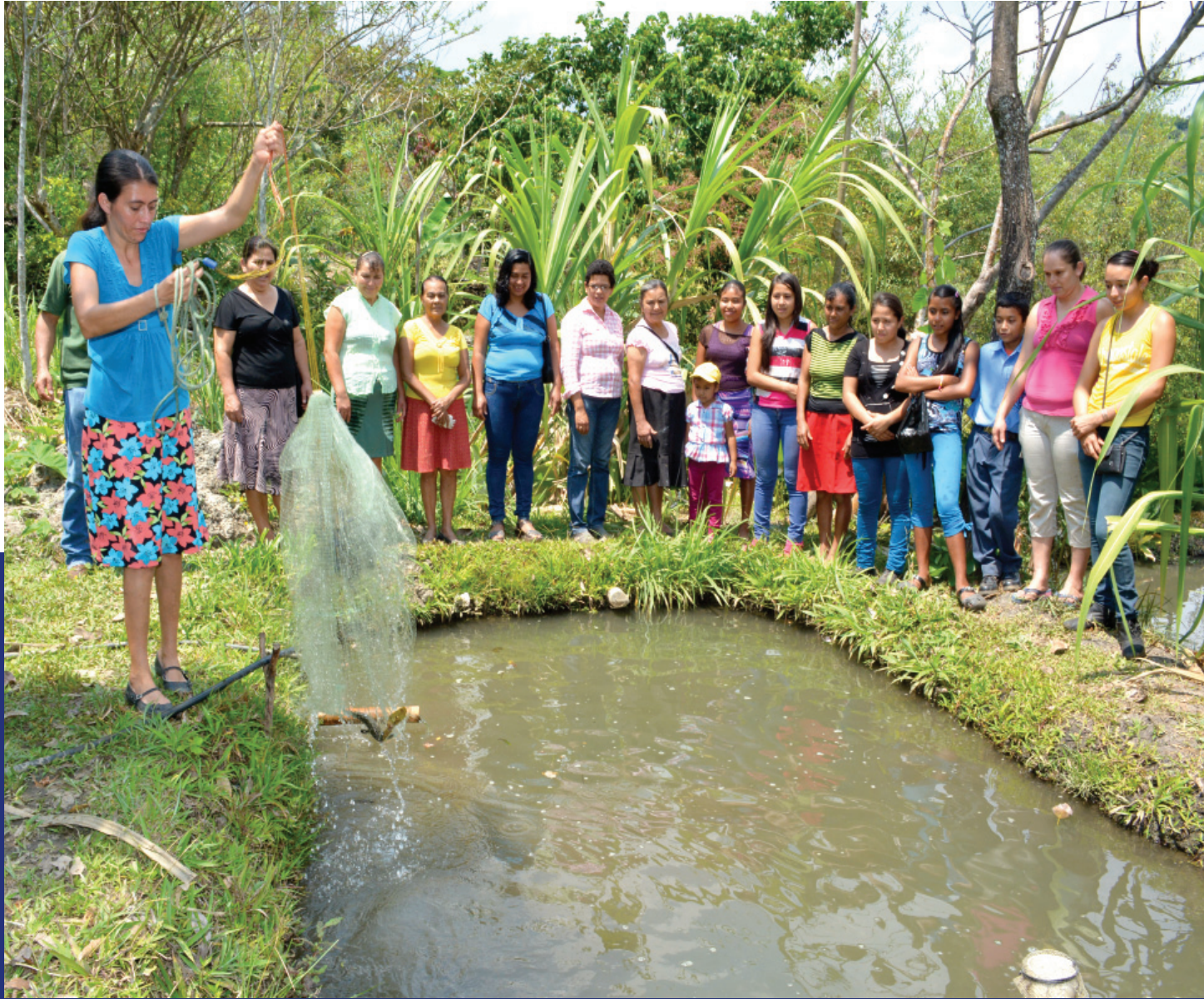
CADER de mujeres, Granados, Baja Verapaz.