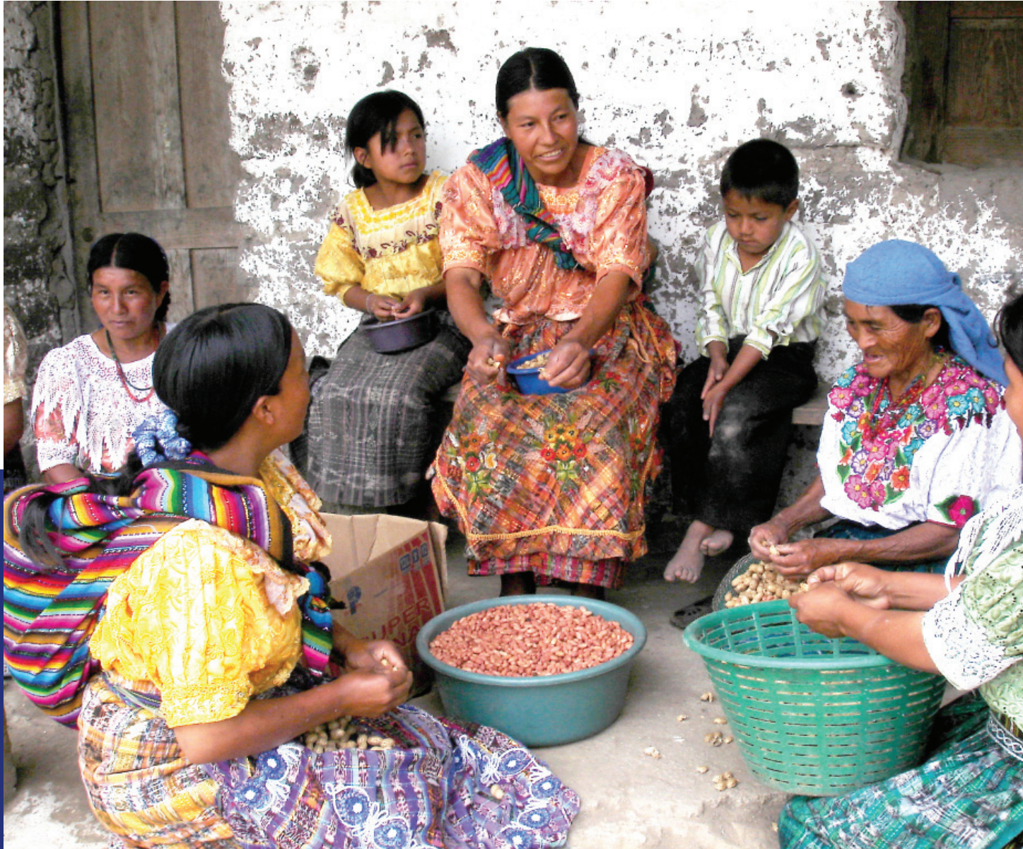
Mujeres de Quiché, cosechando maní.