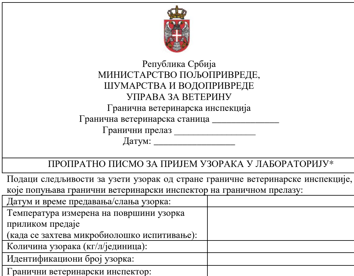
Табела 5 – Пропратно писмо за пријем узорака у лабораторију