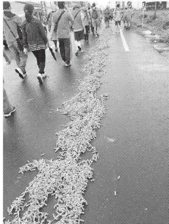
圖、串接或堆疊等錯誤燃放爆竹行為

3. 民眾購買一般爆竹煙火時，應選購貼有認可標示之合格產品，並確認產品上是否具有使用說明、廠商資料及主要成分等相關資訊，以確保安全，認可標示範例如下所示。持有未附加認可標示之爆竹煙火，達中央主管機關所定管制量 5 分之 1，處新臺幣 3 千~1 萬 5 千元罰鍰。